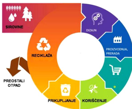
Slika 1. Kružna ekonomija

Slike, tabele, grafikoni i sl. mogu se dati u sklopu teksta, a ako su obimniji na posebnoj stranici u prilogu. Ispod slike piše se redni broj slike i njen naziv. Ako je slika preuzeta od drugog autora, onda se ispod naziva slike navodi izvor iz koga je slika preuzeta ili se to navodi u fusnoti.