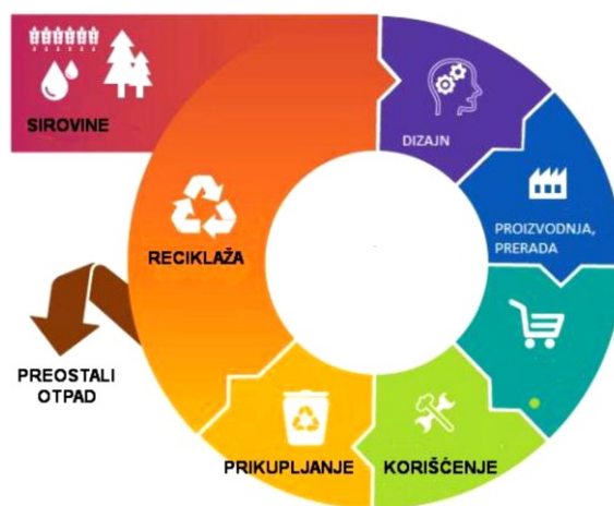
Slika 1. Kružna ekonomija

Slike, tabele, grafikoni i sl. mogu se dati u sklopu teksta, a ako su obimniji na posebnoj stranici u prilogu. Ispod slike piše se redni broj slike i njen naziv. Ako je slika preuzeta od drugog autora, onda se ispod naziva slike navodi izvor iz koga je slika preuzeta ili se to navodi u fusnoti.